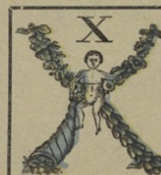
Letter X. Lettre X.