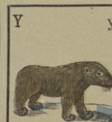
Ysbeer. Ours blanc.