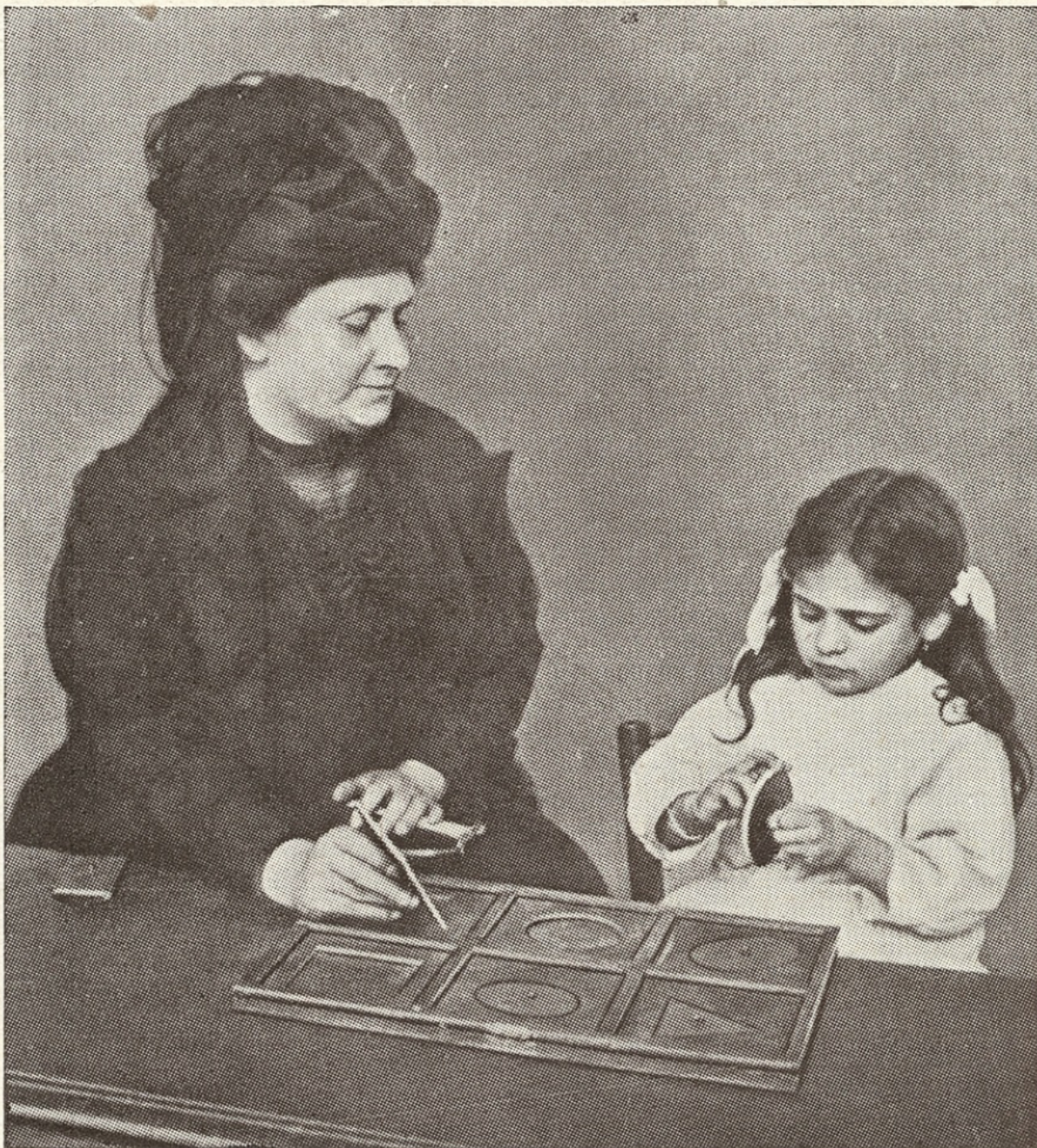
5. UNE ÉCOLE ITALIENNE. — M me Montessori enseignant les emboîtements géométriques.