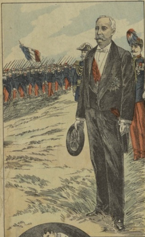
LE PRÉSIDENT aux Grandes Manœuvres