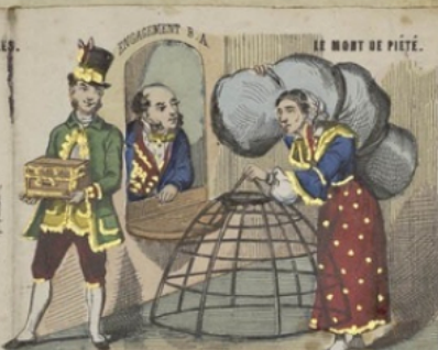
ENVOIEMENT N° 1.

Air: la Bertholite. Dans ce temple de l'instance Dont l'air est si embaumé, Faut-il que l'on se hâte Pour que tout l'air s'en aille!