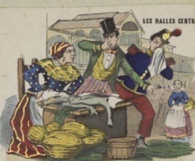
LES HALLES CENTRALES.

Air: du nouveau vaudeville. Dans les arbres des Thilleries, Il se fait bien un jeu de jongleries! Toutes les roses sont fleuries, Ensemble, on se ditait ses champs.