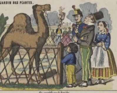
LE JARDIN DES PLANTES.

Air: la bonne aventure. Nous voici d'un moment, D'un lieu si bon à voir, Au lieu de l'observatoire, Et tout de la même.