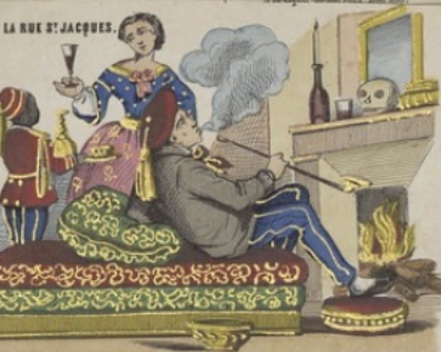
LA RUE ST-JACQUES.

Air: quatre sous de vin. Le pain vous réchauffe, Allez jurer enrouillé! Que d'une noble flamme Pour vos cœurs soient épurés!