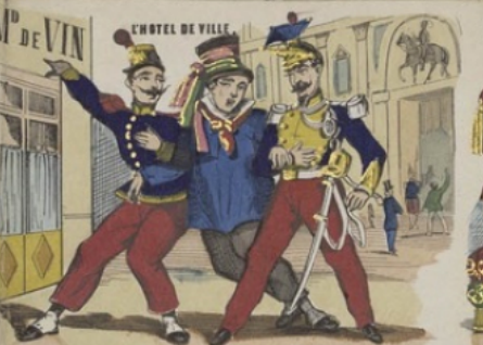
L'HOTEL DE VILLE.

Air: au clair de la lune. Et vous dans la déshé, Des des blancs manteaux, Faites un cabine, Pour vos enfants.