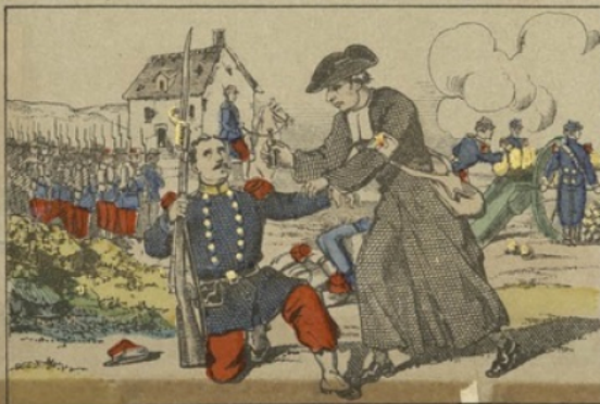
Les frères des écoles chrétiennes secourent les blessés sur le champ.