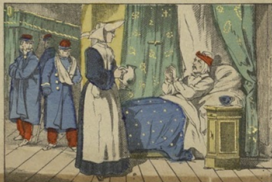
Les sœurs de Saint-Vincent-de-Paul soignent les blessés dans les ambulances.