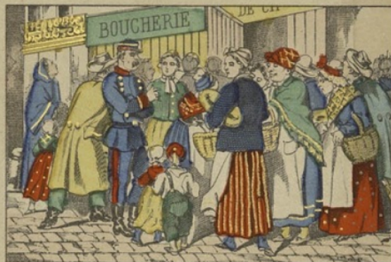
Distribution des vivres à la porte des boucheries.