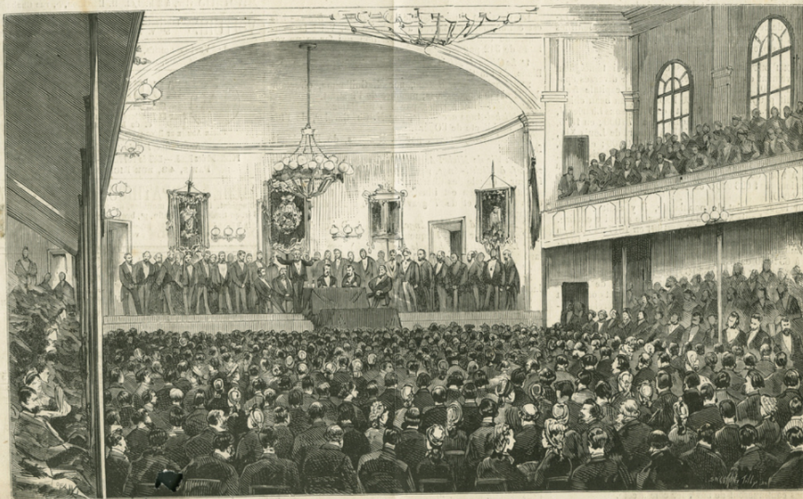
CÉRÉMONIE D'INAUGURATION PRÉSIDIÉE PAR M. JULES SIMON.

Il faut espérer que ses paroles ne demeureront pas sans écho et que les patrons des grandes villes de France tiendront à honneur de suivre l'excellent exemple que leur ont donné les principaux représentants du commerce et de l'industrie navrais.