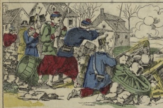
Défense héroïque des habitants de Châteaudun.