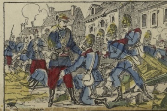
Le capitaine Cruseret fait prisonniers une trentaine de bavaois au combat de Châtillon.