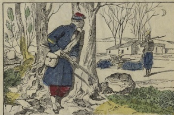
Le sergent Hoff qui se plaçant en embuscade a tué à lui seul plus de cinquante ennemis.