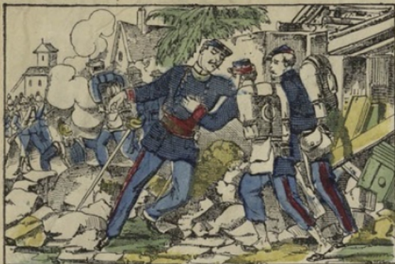
Mort du commandant de Dampierre des mobiles de l'Aube au combat de-Bagneux.