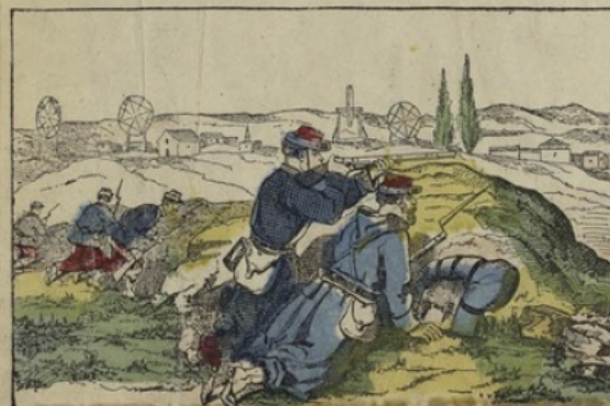
Les Francs-Tireurs à l'attaque du Bourget.