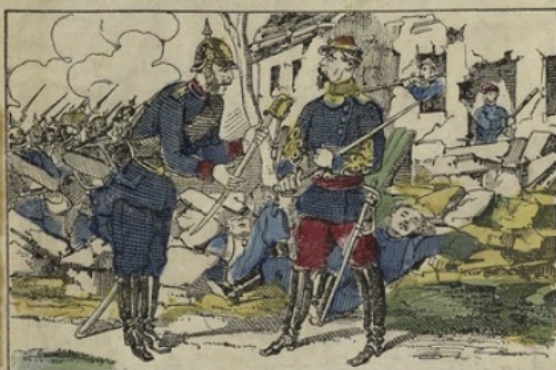
Le colonel Comte reçoit l'épée d'un officier Wurtembergeois au combat de Champigny.