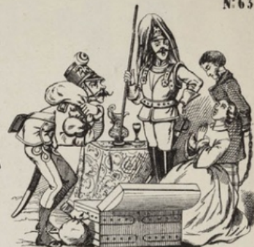
Nouveau moyen de battre monnaie employé par l'Empereur d'Autriche.