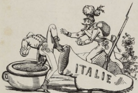
Quitte précipitamment sa botte, il tombe dans le Pô.