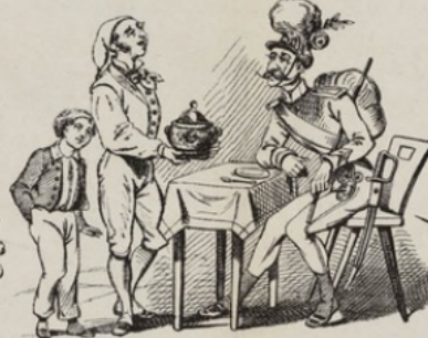
Oui M le sergent, vous allez boire un fameux bouillon.