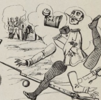
Effet produit sur les Autrichiens par les nouveaux canons rayés.