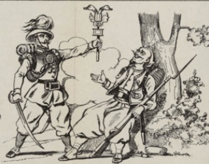
Voilà ma chamo, camarade! Ah! ma foi, ils ressemblent à deux canards.