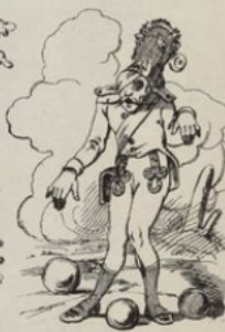
Frappé par les mitrs, battu par les Français, décidément j'ai pas de chance!