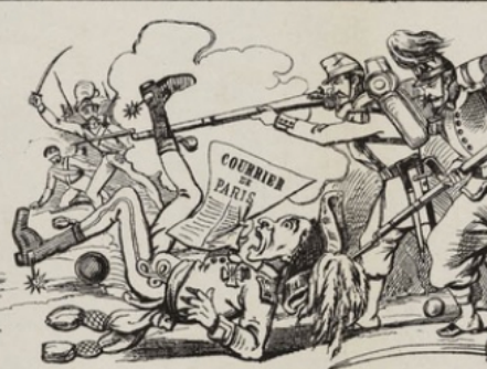
Sapritin ! Les journaux français sont bien informés; les nouvelles nous arrivent en même temps que les événements.