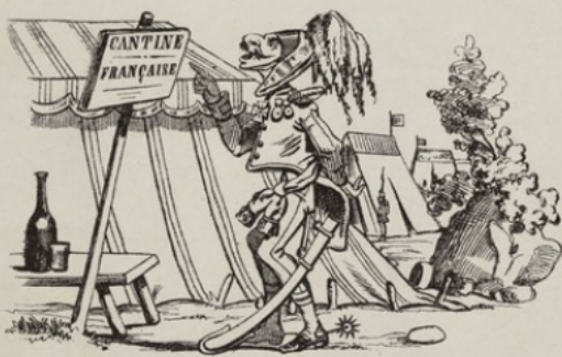
Les Français ont peu comé; ils refusent pas la bête à moi.