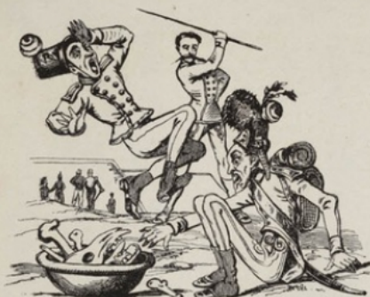
Au service de l'Autriche, le militaire n'est pas riche. Double ration de trique et d'un de cheval.