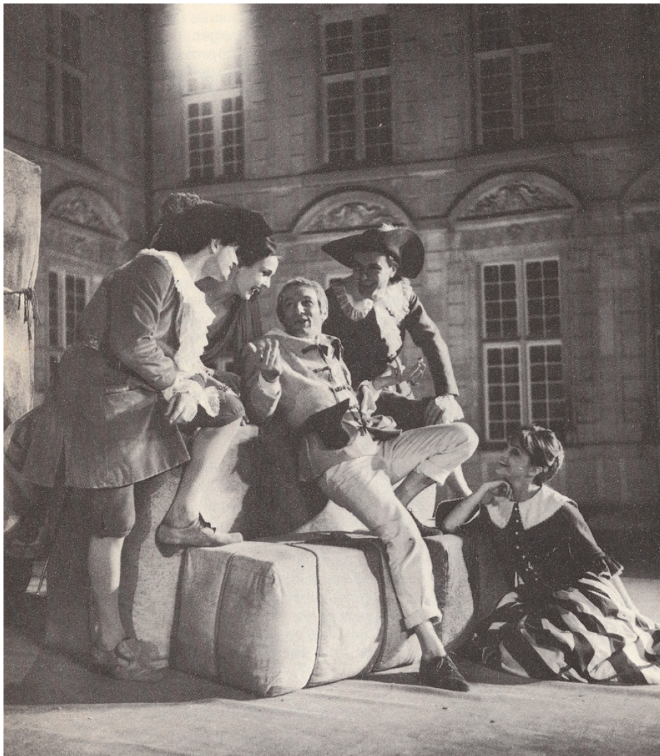
Scapin et les deux couples d'amoureux. Mise en scène d'Edmond Tamiz, Hôtel de Sully, Paris.