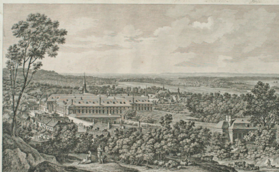
VUE DE S t CIR PRES VERSAILLES, prise au-dessus de la Sablière et en regardant le Coté de Satory. A. P. D. R.

1. Abbaye de St. Cyr 2. Abbaye de St. Cyr 3. Abbaye de St. Cyr 4. Abbaye de St. Cyr 5. Abbaye de St. Cyr