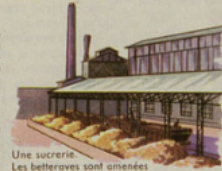
Une sucrerie. Les betteraves sont amenées des fermes de la région.

Exercice. — Dans une boîte de sucre, les morceaux sont bien rangés. Combien y a-t-il de morceaux dans une rangée? Combien y a-t-il de rangées? Combien y a-t-il de morceaux dans la boîte?