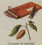
Cacaoyer et chocolat.