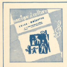
Casse-Noisette (Tchaikovsky) ■ MC - 2501