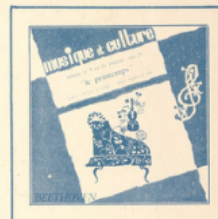
Sonate du Printemps (Beethoven) ■ MC - 3003