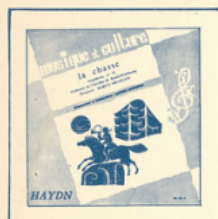
La Chasse (Haydn) ■ MC - 3001