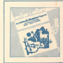
La Chèvre de M. Seguin ■ MC - 2505 (Baumgartner)