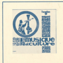
■ MC - 3004