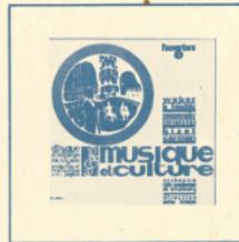
■ M. C. 3006