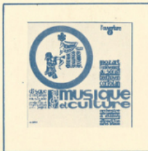
■ M. C. 3005