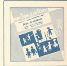
Jeux d'enfants (Bizet) ■ MC - 2503