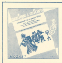
Concerto pour flûte (Mozart) ■ MC - 3002