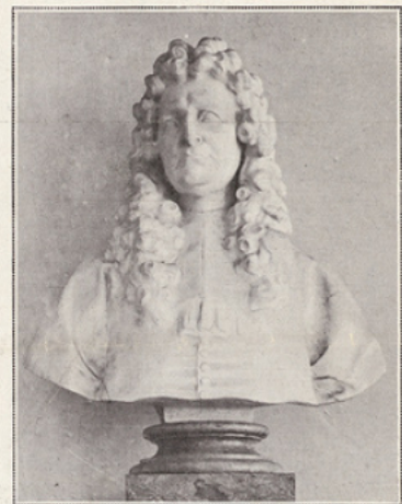
Le buste de Du Cange (1610-1688), auteur du « Glossaire de la moyenne et de la basse latinité », qui a permis de traduire les documents médiévaux.

Le 5 mai 1847 avait lieu l'inauguration officielle de l'École réorganisée par M. de Salvandy. Elle cessait d'être nomade le ministre lui ayant accordé un local indépendant dans le Palais des Archives. On entrait à l'école par la porte dite de Clisson pour pénétrer dans la bibliothèque, belle salle qui sert aujourd'hui au dépôt des inventaires des Archives nationales ; les cours se donnaient dans le charmant salon blanc ovale qui vient d'être si joliment restauré et doté d'un nouveau mobilier de l'époque Louis XIV. L'Oratoire des