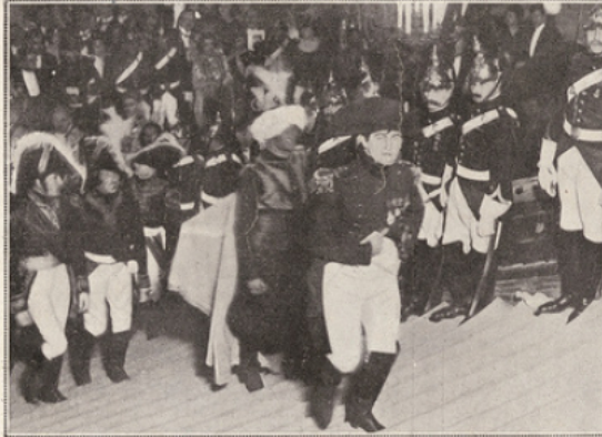
Napoléon et son fidèle Mameluk.