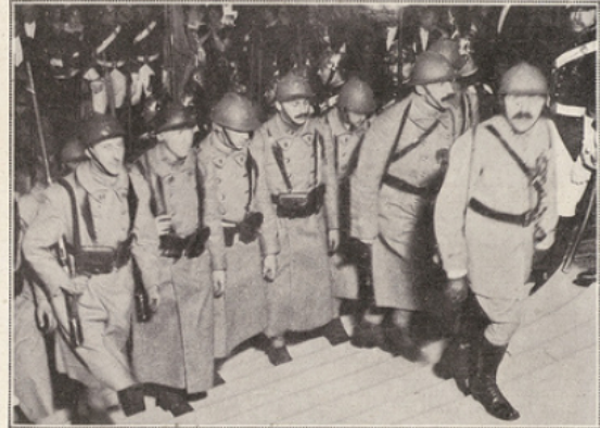
Les soldats de la grande Guerre.