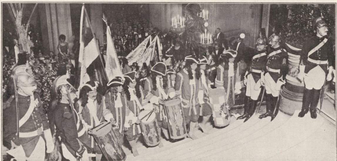
Les tambours des Gardes françaises.

Les bénéfices de cette fête ont été distribués à la Caisse de Prévoyance de la Maison des Journalistes, à la Fondation de la Victoire, à l'Aide des veuves de militaires et à l'Association des mutilés de la guerre.