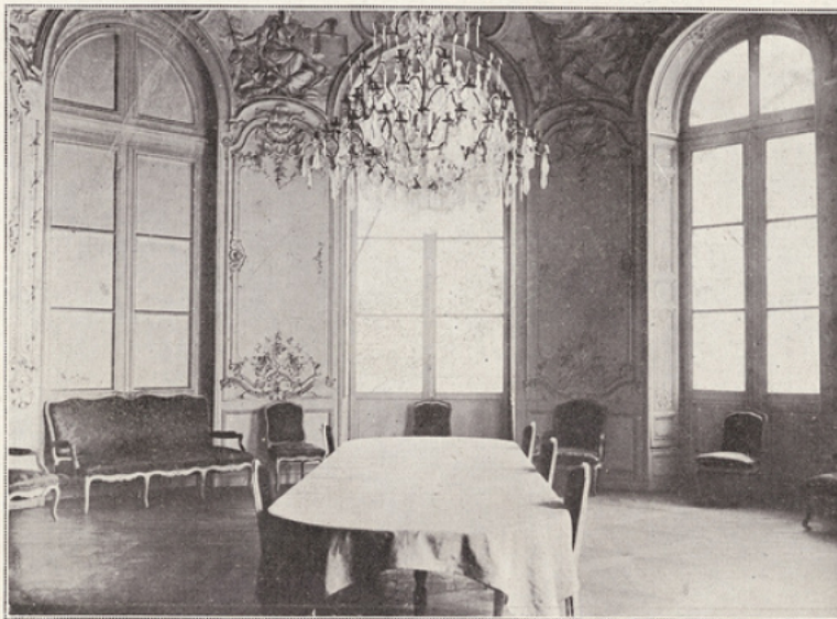
La Salle ovale aux Archives nationales, où avaient lieu les cours de l'École des Chartes.

On ne saurait dire que dans cette salle noirete se sont pressées des générations d'élèves car chaque année l'école n'ouvre ses portes qu'à une vingtaine d'élèves de telle sorte qu'elle ne compte jamais plus de soixante élèves pour les trois promotions qui en suivent l'enseignement, le cycle des études étant fixé à trois ans. Néanmoins, aussi bien dans cette école peu confortable que dans la délicieux salon ovale du Palais Soubise, nombre de jeunes hommes studieux ont entendu les leçons de maîtres éminents. Parmi les disparus rappellerai-je les noms de Francis Guessard, Benjamin Guérard, Boutaric, de Mas-Latrie, Champollion Figeac et Jules Quicherat le rénovateur de la science archéologique en France. Ces maîtres ont formé des archivistes qui, à leur tour, sont devenus ces savants réputés dans l'univers entier et dont chaque année, des