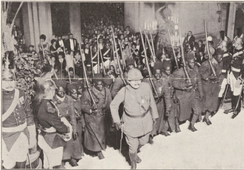
Les héros de l'Armée noire.