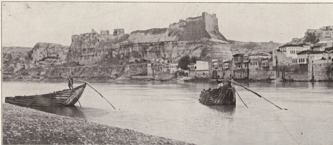
L'Euphrate dans la région d'Aïn Tab. Le château-fort de Biredjik.