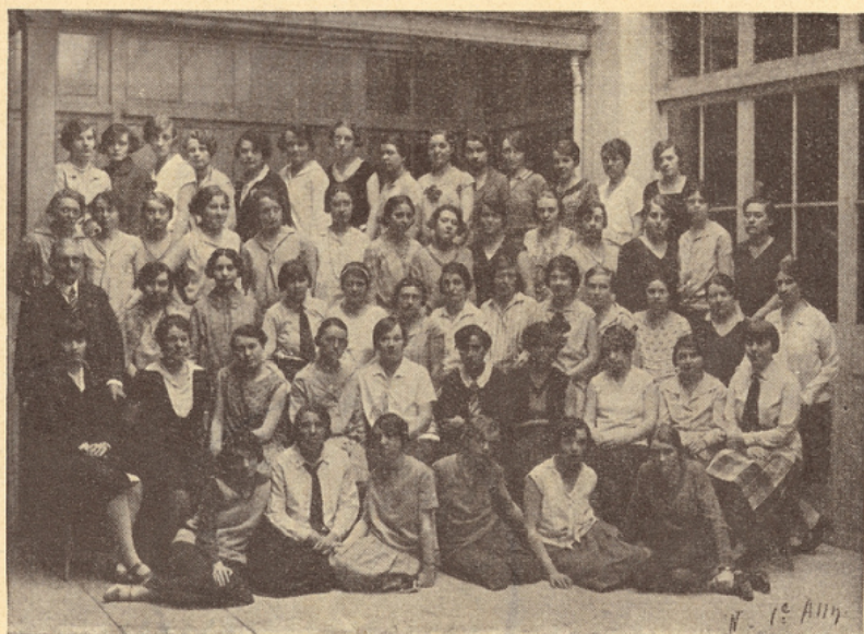
Une récente promotion

vées, soit de pouvoir, éventuellement, gérer elles-mêmes leur fortune.