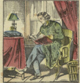
Ernest devint un savant et fut constamment entouré de la considération et de l'estime de tous.