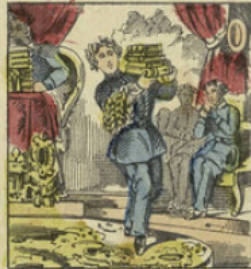
À la distribution des prix, Ernest pliait sous le poids des livres et des couronnes.