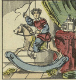
Ses parents le gâtaient fort, et, comme il était fils unique, ils présentaient ses moindres caprices: chevaux de bois, bergères, petits canons, sucres jouet ne lui était refusé.