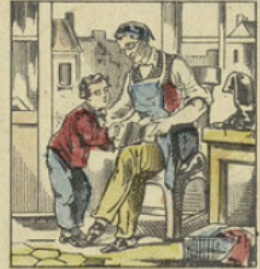
Son père ne pouvait lui acheter des jouets, mais on lui avait donné un alphabet; à cinq ans il connaissait déjà toutes ses lettres.