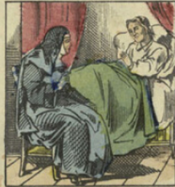
Un revers de fortune ruina complètement les parents de Paul; il mourut misérablement à l'hôpital, son ignorance l'ayant empêché de se livrer à aucun travail.