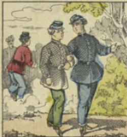
Ernest, tous les dimanches et tous les jeudis, allait à la promenade avec ceux de ses camarades qui étaient studieux comme lui.