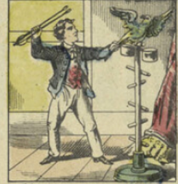
Il lui arrivait même de battre sa bonne, de donner des coups de pied au vieux chien de sa grand-mère, de frapper la perruche sur son perchoir.