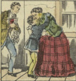
Les parents d'Ernest étaient heureux: sa mère ne pouvait se lasser de l'embrasser et son père pleurait de joie.