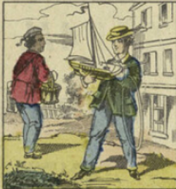
Parfois il rencontrait Paul tout chargé de joujoux et lui jetait des regards d'envie.