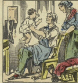
Car les braves gens avaient un fils qui était joli comme un petit ange, et qui annonçait déjà les plus heureuses dispositions.