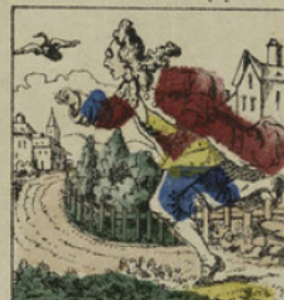
Le maître d'école, terrifié, s'élança à travers champ à la poursuite de l'oiseau.