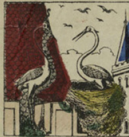
La cigogne, maîtresse du nid, arriva en toute hâte et demanda à la vieille ce qu'elle venait faire dans ce lieu inhabité.