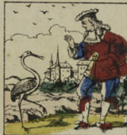
Le maître d'école fut immédiatement changé en cigogne, et le vieil oiseau devint un jeune seigneur fort bien vêtu, nommé Badour-Badour.