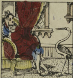
Et encore, il ne devait reprendre sa première forme qu'à la condition de donner à un oiseau. Le maître d'école vint trouver le prince Badour-Badour.