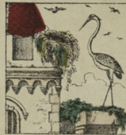
Or, un matin, une vieille cigogne vint à passer par là et, voyant un nid suspendu aux antiques créneaux, s'approcha et le regarda avec intérêt.