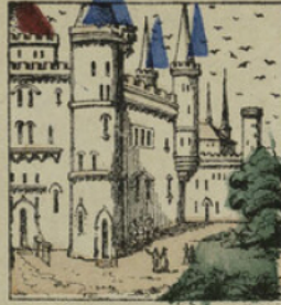
Il est de fait que ce manoir n'était qu'une habitation que par des hiboux qui ne faisaient que crier toute la nuit.