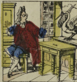
Quand vint le soir, il vit une vieille cigogne entrer par la fenêtre dans sa chambre.