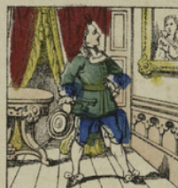
Badour-Badour avait été changé en cigogne, par une vieille fée qu'il avait mécontentée, et condamné à rester ainsi métamorphosé cinquante ans.