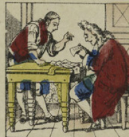
Il alla trouver immédiatement le maître d'école du pays qui, après avoir essuyé ses lunettes sur son nez, lut avec attention les fameux papiers.