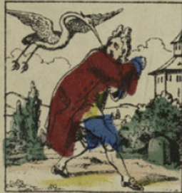
La cigogne, le voyant courir, descendit sur la terre et lui donna un grand coup de bec.