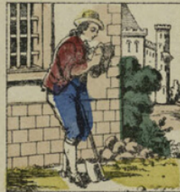
Un bûcheron, qui passait par là, le ramassa tout étonné et l'ouvrit; il y trouva une quantité de papiers et de parchemins.