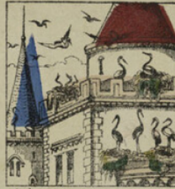
Quelquefois, cependant, des cigognes venaient au printemps établir leur nid sur le haut des tourelles.