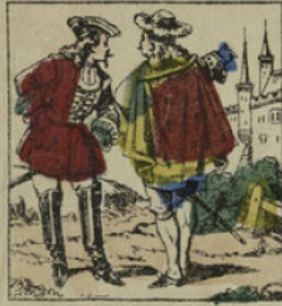
Il était une fois un vieux manoir que l'on disait hanté par les esprits.