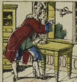
Prendre la clef du secrétaire sur la table, ouvrir le secrétaire avec son bec, prendre le portefeuille et s'enfuir avec les papiers.