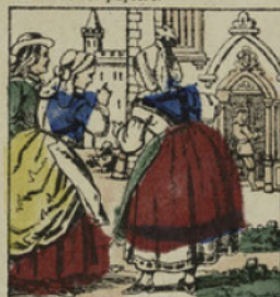
Badour-Badour prit possession du château; tous les habitants du pays ne comprenaient rien au changement qui s'était opéré dans ce manoir.