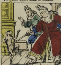
Ce dernier s'excusa sur son peu de puissance et ne put que changer le maître d'école en singe.