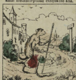
Le pauvre maître d'école, plus satisfait d'être singe que cigogne, partit chercher aventure, et nous vous dirons un jour ce qu'il est devenu.