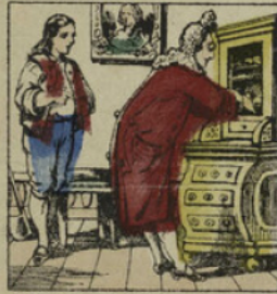
Mais comme il n'y comprit rien, il dit au bûcheron qu'il lui rendrait réponse le lendemain et mit le portefeuille dans son secrétaire.