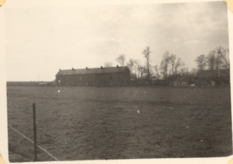
une cité ouvrière en pleine nature