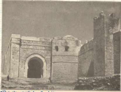
Rabat: porte des Andalous - ↓ arabesques

Le Art musulman, imité de des autres pays est originale par sa décoration surtout géo- métrique (arabesque)