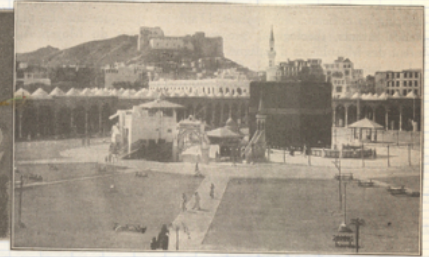
↳ La abèque : la traaba