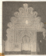
Intérieur de la grande Mosquée de Kairouan →