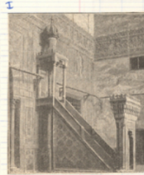
↳ Mihrab et Minbar.