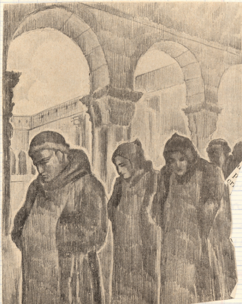
Moine dans une cloître