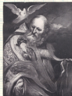
GRÉGOIRE LE GRAND Attribué à G. de Crayer Musée de Pau

Les paroles sont en latin et, de nos jours il est surtout chanté dans les monastères