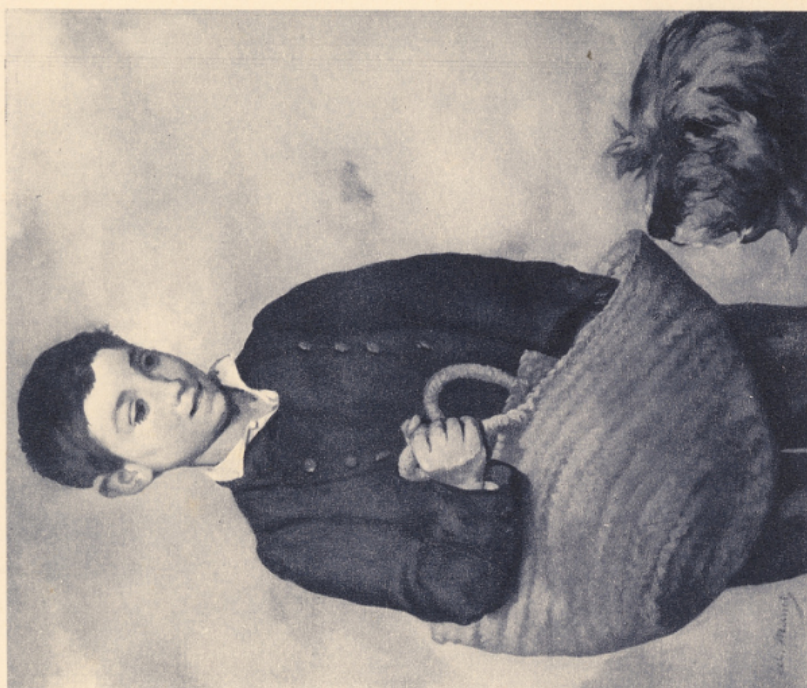
Pl. 12 - Edouard MANET (1832-1883) - L'enfant au chien