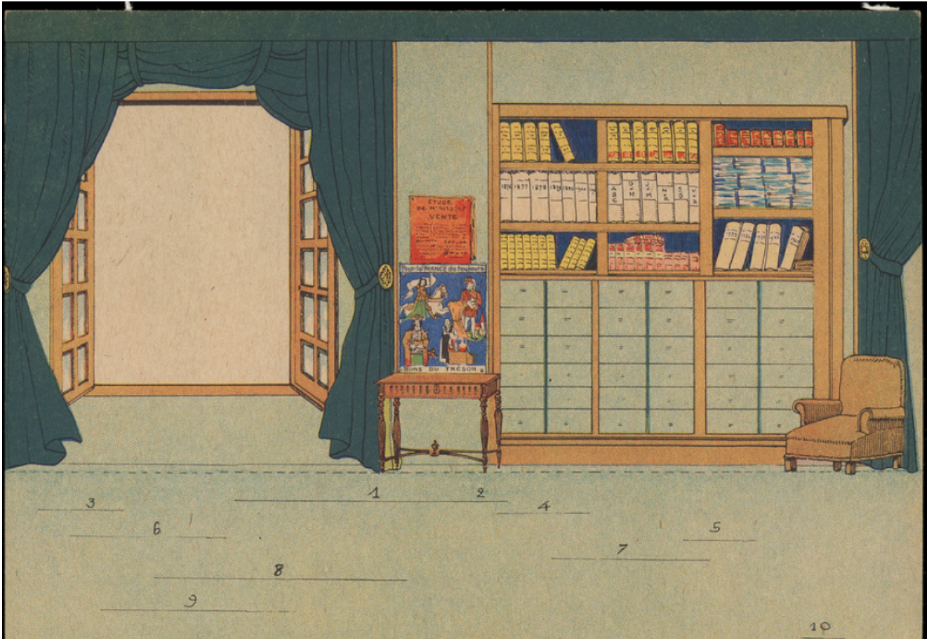
AUNIS ET SAINTONGE. Vente aux chandelles chez un notaire charentais à Saint-Jean-d'Angely (Char.-Maritime).