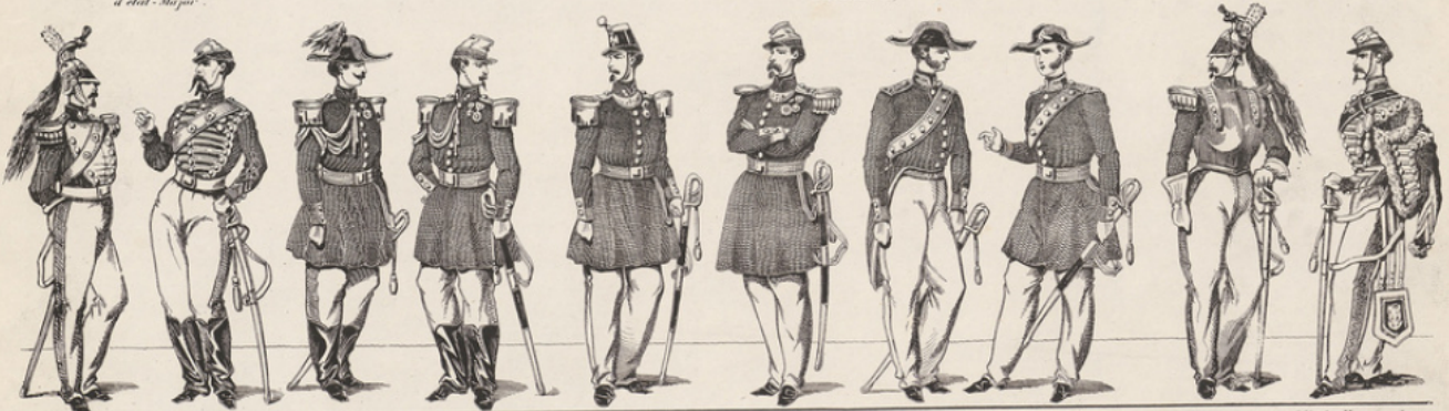
Colonel de Dragons, Off. Ch. d'Officier, Aides de Camp, Capitaine, Chef de bataillon, Chirurgiens Majors, Courassier, Off. de Hussards, Chef d'escadron.