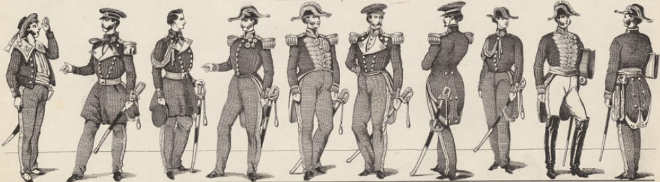
Mateelot, Officier, Aspirant, Capitaine de Vaisseau, Amiral, Capitaine, Capitaine de Corvette, Élève, Intendant, Sous-Intendant. Imprimerie Lith. de Pellierin, à Epinal. Propriété de l'Éditeur. Déposé