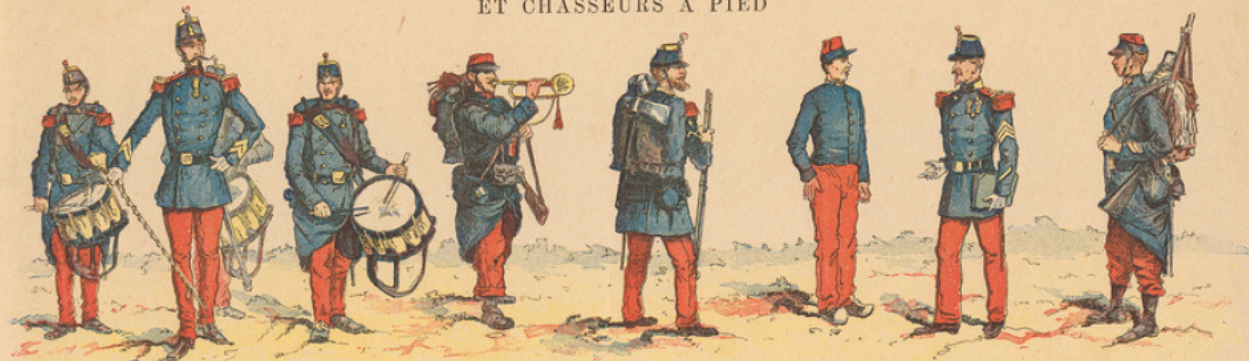
Tambour-major et Tambours.

A. QUANTIN, IMPRIMEUR-ÉDITEUR. 7, rue Saint-Benoît, Paris.