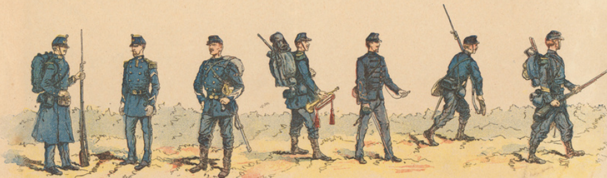
Chasseur à pied.