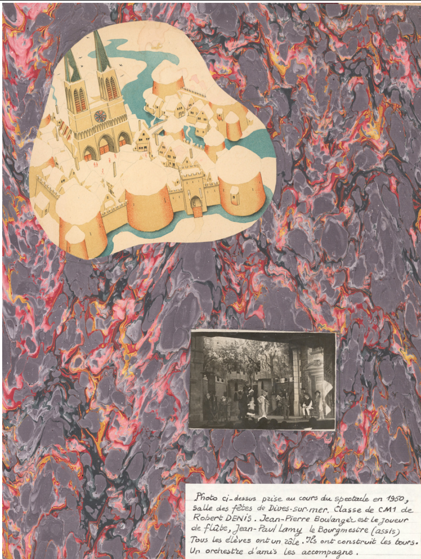
Photo ci-dessus prise au cours du spectacle en 1950, salle des fêtes de Dives-sur-mer. Classe de CM1 de Robert DENIS. Jean-Pierre Boulanger est le joueur de flûte, Jean-Paul Lamy le Bourgmestre (assis). Tous les élèves ont un rôle. Ils ont construit les tours. Un orchestre d'amis les accompagne.