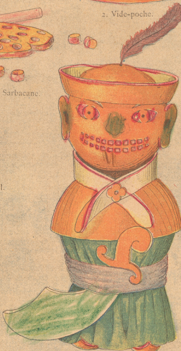
6. Pirate tonkinois.