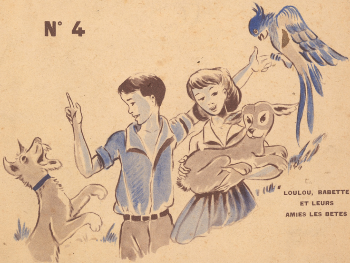
LOULOU, BABETTE ET LEURS AMIES LES BETES