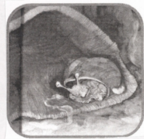
sa sa cave !