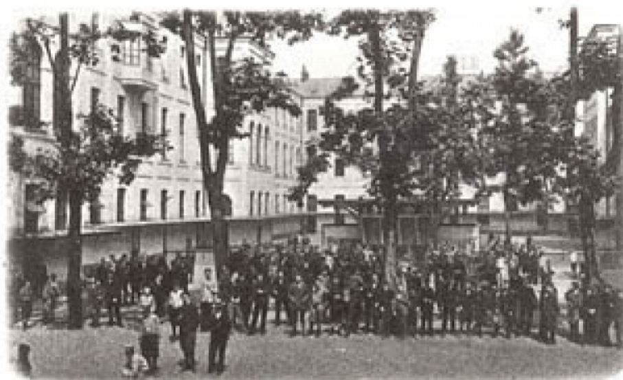
Lycée Faidherbe. — Cour des grands