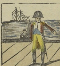
Vertrek van Napoleon naar Elba. — Verwijder u, generaal! ik wil niet dat men ons kunnen veronderstellen dat een Fransman mij aan mijne vijanden heeft overgeleverd. Adieu de Napoléon. — Retirez-vous, général! je ne veux pas qu'on puisse croire qu'un français s'en vaudra me livrer à mes ennemis.