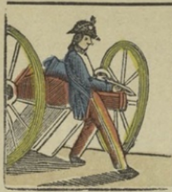
Bonaparte bij de belegering van Toulon beveelt het geschut en zegt tot zijne krüggelingen: vromden! morgen nacht slapen wij in de stad. Bonaparte au siège de Toulon commande les batteries et dit à ses camarades: demain, mes amis, vous coucherez dans la ville.