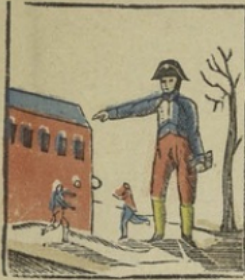
Bonaparte op de militaire school te Brienne bereikt den leeftijd en de verdediging der met nieuw vernieuwde veranderingen op het voornaamste plein van het gesticht. Bonaparte à l'école de Brienne commande l'attaque et la défense des forts construits avec de la neige dans la principale cour.