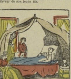
De dood. — In den morgen van den 5 Mei 1821 gaf Napoleon den geest te midden zijner doorlichtige vrienden. La mort. — Le matin du 5 mai 1821, Napoléon rend le dernier soupir au milieu de ses illustres amis.