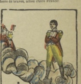
De vergoeding. — Napoleon wordt in 't verblijf der onsterfelijkheid onthaald door de dapperen van al de deelen der wereld. L'apothéose. — Napoléon est reçu au séjour des immortels par les braves de toutes les parties du monde.