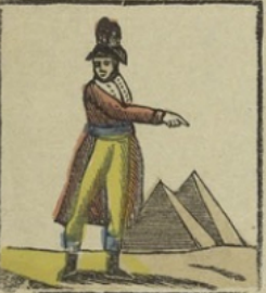
Bonaparte in Egypte. — Soldaten! zegt hij tot het leger, van de hoogte dier gedenkzaken, wordt u moed door veertig seuen bewaard. Bonaparte en Egypte. — Soldats, dit à son armée, du haut de ces monuments, quarante siècles vous admirent.