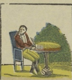
Napoleon te Fontainebleau. — Op zijne beurt overwonnen zijnde, leekst hij de akte waarbij hij de kroon afstaat ten voordeete van zijn jeuglig zoonje. Napoléon à Fontainebleau. — Vaincu à son tour, Napoléon, signe l'acte d'abdication en faveur de son jeune fils.