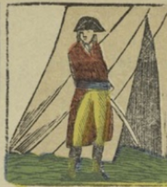
Bonaparte in het kamp te Lodi. — Na den vesting van Lodi benoemen hem de soldaten tot korporaal. Bonaparte au camp de Lodi. — Après la bataille de Lodi, il est nommé caporal en rentrant au camp.