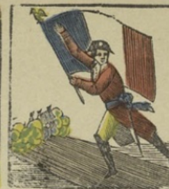
Bonaparte op de brug van Arcole zegt tot het leger: kinderen! zijt gij de overwinnaars niet van Lodi? De mij het hoort, voigt mij! Bonaparte au pont d'Arcole dit à son armée: enfants, s'êtes vous plus les vainqueurs de Lodi? Qui m'aima, m'a suivi!