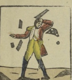
Batalje van Eylau. — Een hem eenmaal de hoed door een kanonkogel werd afgeslagen, stelde Napoleon zich aan 't lachen en zeide: ware het een paar duim lager, dan was het met mij gedaan geweest. Le champ de bataille. — En voyant son chapeau emporté par un boulet, Napoléon se mit à rire en disant: deux pouces plus bas, c'était fini de moi!