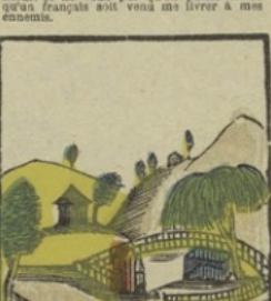
Het graf. — In een diep tal, midden van onvruchtbare rotsen, onder een treurwig, rust het overzacht van Napoleon. Le tombeau. — Dans une vallée profonde au milieu de rochers stériles, sous un saule pleureur, reposent les cendres de Napoléon.