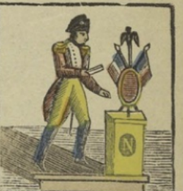
Oorlogsverklaring. — Napoleon eene oorlogsverklaring ontvangende hebbede, begaf zich op marsch, en is gevoerd tot op den oever der Niemen. Déclaration de guerre. — Napoléon ayant reçu une déclaration de guerre, s'est mis en marche et est arrivé sur les bords du Niemen.