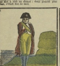
Napoleon op 't eiland St. Helena. — Napoleon wordt gevangen gehouden door de Engelsen, zijne grootste vijanden. Hij zinde: er ontbrak mij niets meer dan die rampspoet. Napoléon à Ste. Hélène. Napoléon prisonnier des Anglais, ses plus grands ennemis, dit: il ne me manquait plus que cette adversity!