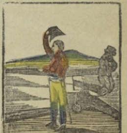
De kaap Hogu. — Napoleon groot voor de laatste maal zijn Vaderland met dese woorden: vaarwel! vaarwel! land der dapperen, vaarwel geleid Frankrijk! Le cap de la Hogu. — Napoléon salue sa patrie pour la dernière fois: adieu, adieu, terre de braves, adieu chère France!