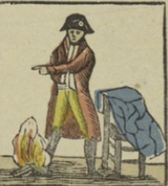
Napoleon geeft de vredesvoorwaarden op aan de gezanten der vreemde mogendheden, die hem het eindigen van den oorlog afsmaken. Napoleon dicte la paix. — Napoléon dicte les conditions de la paix aux pléipotentiaires des souverains étrangers.