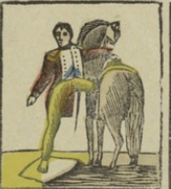
Napoleon te Russenbergr. — Gekwetst in den strijd, vat hij moedigen de teuzels van zijn paard om 't leger ter hulp te asselen. Napoleon à Ratisbonne. — Napoléon blessé devant Ratisbonne, saisit la bride de son cheval pour voler au secours de son armée.