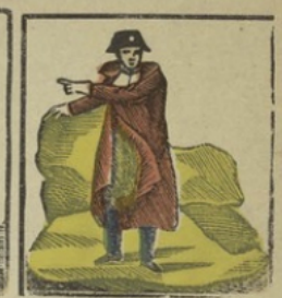
Bonaparte op den berg St. Bernard schrijft op de rots zijnen naam boven dien van Annibal, die de Romeinen overwon. Bonaparte au mont St. Bernard écrit sur les rochers son nom au-dessus de celui d'Annibal, qui fut vainqueur des Romains.