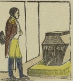
Napoleon bezoekt het graf van den grooten Fritz. Napoleon visite le tombeau du grand Frédéric.