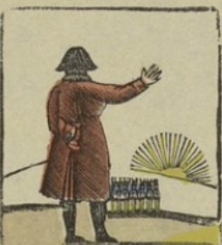
De slag van Eylau. — Toen Napoleon de son aan den geschiedschrijver zag oplagen, zei hij tot zijne soldaten: kinderen! ziet de zon van Austerlitz komt op. Bataille d'Eylau. — Napoléon voyant le soleil se lever à l'horizon, dit à ses soldats: enfants! voici le soleil d'Austerlitz!