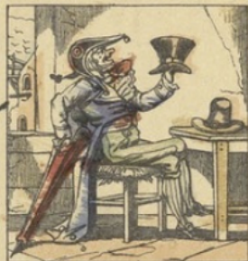
Cadet Rousselle a trois chapeaux.