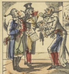
Cadet Rousselle a trois deniers.