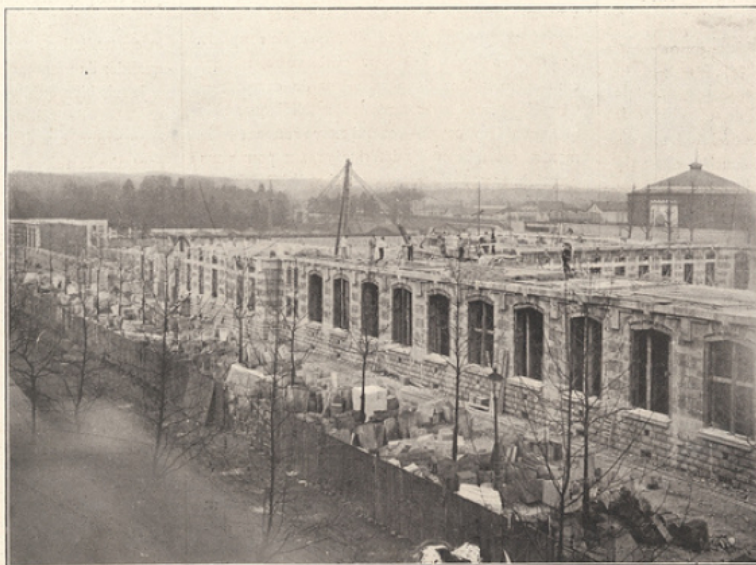
L'état actuel des travaux

Dans le pavillon central, au rez-de-chaussée, en façade sur un jardin coquet, se trouvent les bureaux, parloirs, économe, bureaux du proviseur, du censeur; au-dessus, les logements du haut personnel