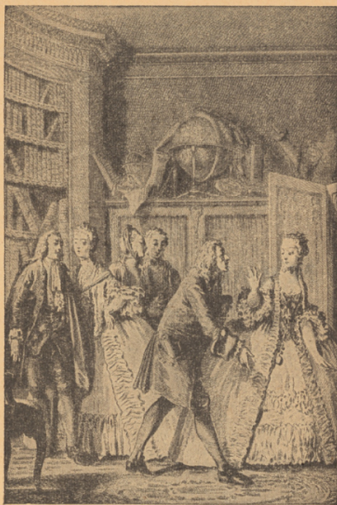
Dessin de J.-M. Moreau le Jeune, pour l'édition du Théâtre de Molière, 1773.