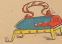
Strijkijzer. Fer à repasser.