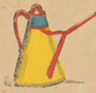
Oliekruik. Cruche à l'huile.