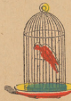
Papegaalkooi. Cage de perroquet.