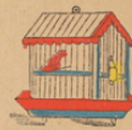
Vogelkooi. Cage d'oiseau.