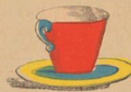
Tas en schoteltje. Tasse et soucoupe.