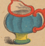
Melkkan. Cruche au lait.