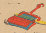
Borstel en blik. Brosse et pelle.