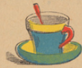
Tas, schoteltje en lepel. Tasse, soucoupe et cuiller.