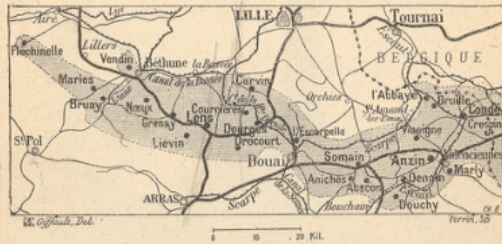
BASSIN HOUILLER DU NORD ET DU PAS-DE-CALAIS.

La présence de cette couche de houille, dans un pays plat, où les lignes ferrées ont été aisément construites et sans grands frais, où les canaux ont été vite creusés, où les rivières sont lentes, paisibles et navigables, où les matières premières, venues des divers points du globe, sont transportées commodément, toutes ces causes ont contribué à faire de la région du Nord une des principales régions industrielles de France, et le pays qui était déjà une région de