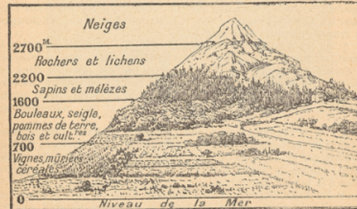
ÉTAGEMENT DE LA VÉGÉTATION DANS LES ALPES.

Par suite de la diminution progressive de la température à mesure qu'on s'élève sur une montagne, on distingue de bas en haut plusieurs zones de végétation : sur une même montagne des Alpes, on rencontrera, de bas en haut, des oliviers et des vignes, puis des champs de céréales, puis des forêts, puis des prairies ou alpages, enfin