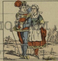
Polichinel et son épouse Co- lombine.