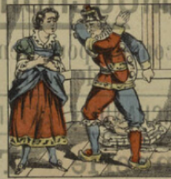
Il soufflette sa femme qui lui réclame son enfant.