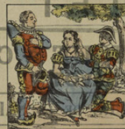
Il déclare sa flamme à Colombine, qui lui préfère Arlequin.