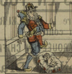
Polichinel a fait taire son enfant, qui s'écrie.