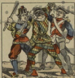
Polichinel et Arlequin rossent le quel.