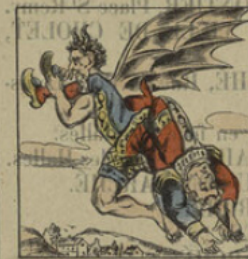
Le diable emporte Polichinel.