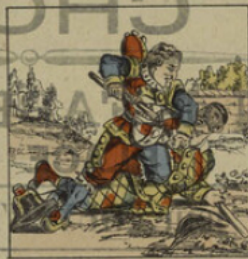
Polichinel se bat avec Arlequin.