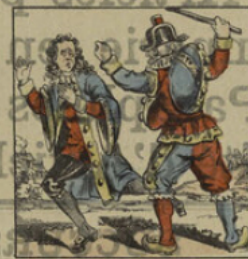
Il rossé le commissaire.