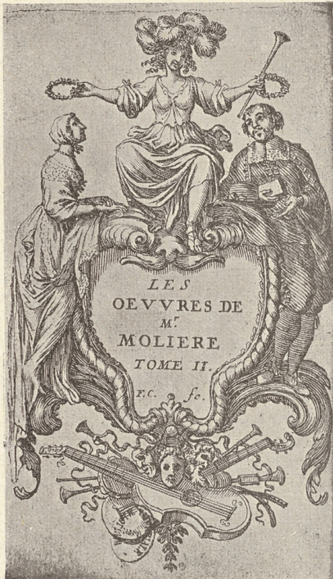
1. Molière dans un rôle de bourgeois (d'après F. Chauveau).

On n'a pas de document contemporain représentant Molière dans Chrysale; mais le costume de Molière dans le rôle d'Arnolphe peut sans doute donner quelque idée de son costume dans les rôles bourgeois. D'ailleurs le costume de Chrysale était ainsi composé : « justaucorps et haut-de-chausses de velours noir, veste de gaze violette et or garnie de boutons, un cordon d'or, jarretières, aiguillettes et gants ».