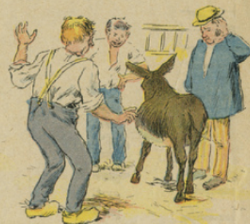
L'aubergiste et Jacques ne savent à quoi attribuer l'embonpoint inusité de Manon.