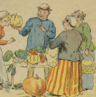
Après avoir laissé l'ânesse à l'auberge, il vend au marché les primeurs dont il s'est muni.