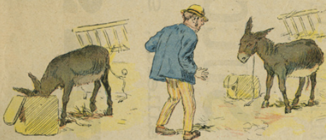
Manon, mal attachée, a su trouver le coffre au son et a tellement mangé qu'elle en est gonflée.