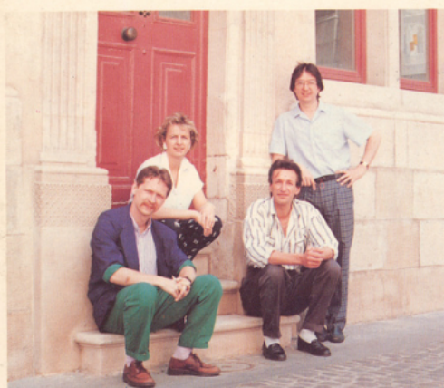
GENS DE LORRAINE

Illustrations et calligraphie : Danièle SCHULTHESS Production : Gens de Lorraine - SRC .