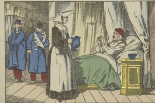
Les sœurs de Saint-Vincent-de-Paul soignent les blessés dans les ambulances