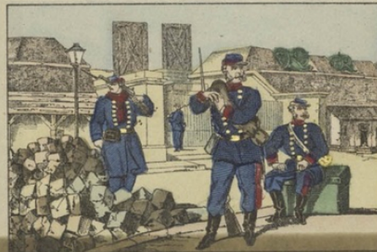
La garde nationale garde les remparts.