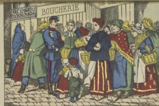
Distribution des vivres à la porte des boucheries.