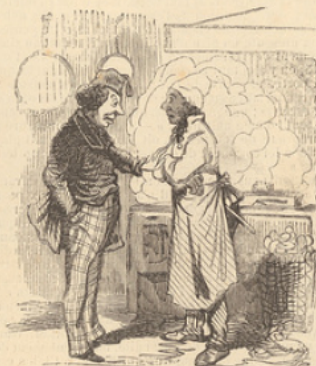
Si le poisson est cher, il ne faut pas en acheter ; je vais les flanquer tous au pain sec.