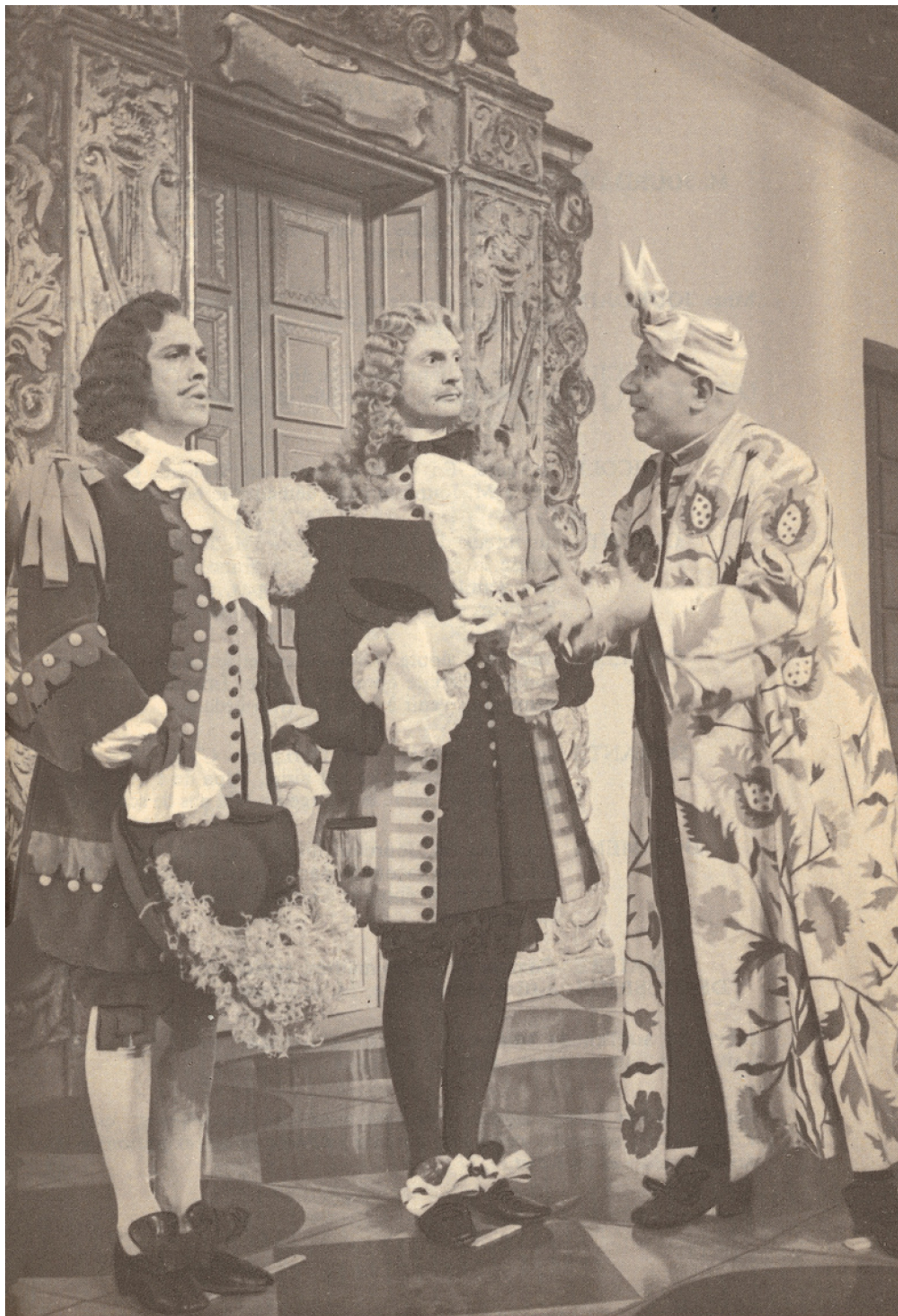
Filmsonor, les Productions Cinématographiques