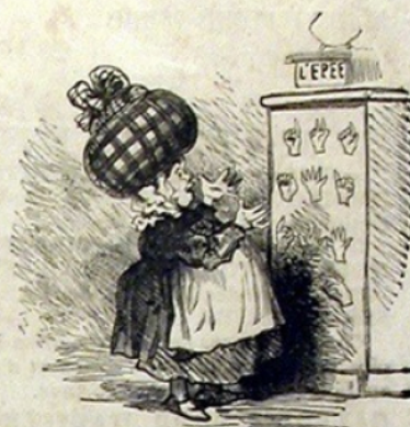
Un né muet.