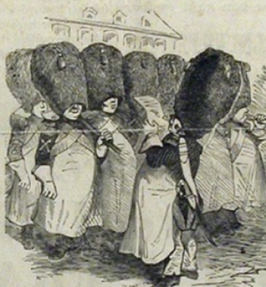
La-h: muette. — Le supercr Barbléon ne répondant pas à l'appel est porté absent.