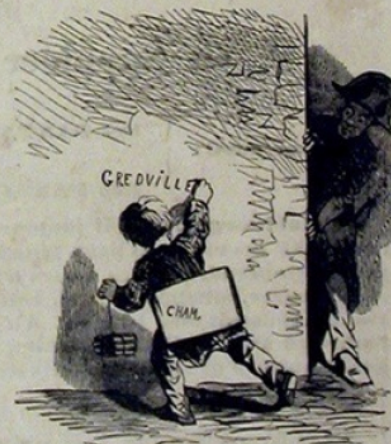
Un Nom commun.