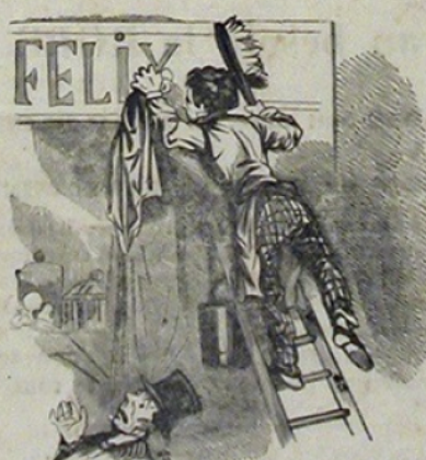
Un Nom propre.