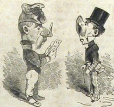
Un nez fermé. — Un nez ouvert.