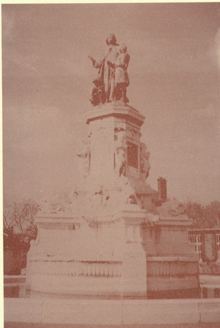
Place St. Clément : Statue Jean Baptiste de la Salle

En couverture, Plan de Rouen et de St. Sever dit plan des Echevins (1784)