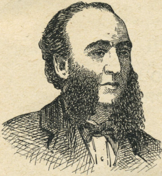
JULES FERRY (1832-1893).

Jules Ferry a deux titres principaux à la reconnaissance des Français ; à son premier ministère se rattachent les plus importantes lois sur l'instruction publique, et c'est lui qui nous a donné la Tunisie et le Tonkin.