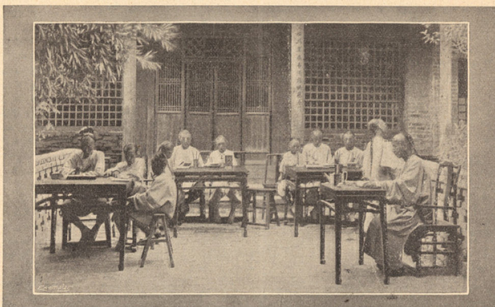
Salle d'étude. — A droite, le maître fait réciter un des écoliers.

Le maître commence son enseignement en lisant à haute voix, distinctement, les caractères qui composent les quatre premières lignes. Son petit élève, avec la même intonation, l'imité exactement. La leçon se répète, toujours la même, jusqu'à ce que l'enfant puisse lire couramment, correctement, les douze caractères; alors, il retourne à sa place, pour les apprendre par cœur. Il les répète des centaines de fois, en haussant son diapason, tout en se balançant de ci de là sur son tabouret, d'après un rythme monotone. Les autres garçons font de même, en sorte que le bruit est assourdissant pour qui n'y est pas habitué. Mais