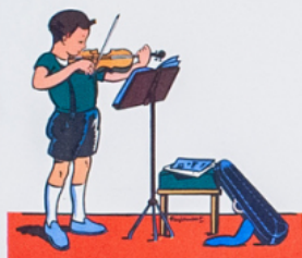
ré mi é tu die u ne mé lo die