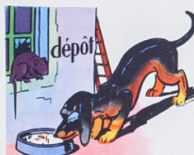
to bi di ne - un ra! rô de