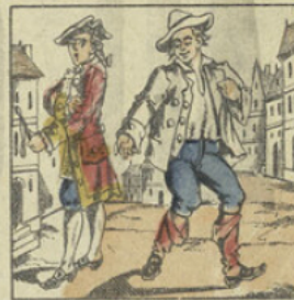
JEAN-FARINE. Ce Jean était meunier, ayant vidé chopine Conduisait les passants, en disant s'enfarine.