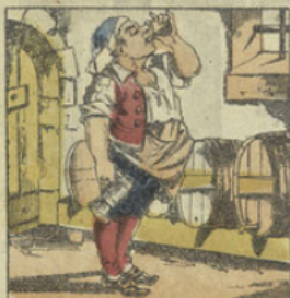
JEAN-CAVE. L'ainé trouvant au vin le goût le plus suave, Disait mon seul bonheur est lorsque s'encave.