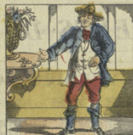
JEAN-VOLE. J'ai trouvé de l'argent, là, sur cette console; Je trouve! c'est pour moi; l'on dira que s'en vole.