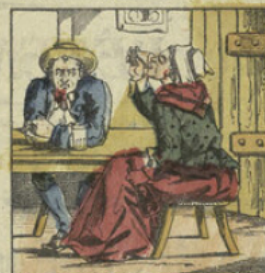
JEAN-SOUFFRE. Ma femme boit pour deux, et l'on dirait un gouffre; Ce que je gagne y passe, hors jurez si s'en souffre.