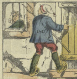
JEAN-FERME. Celui-ci surprenant des filous dans la ferme, Tire la porte, et dit, vous volez, moi, s'enferme.