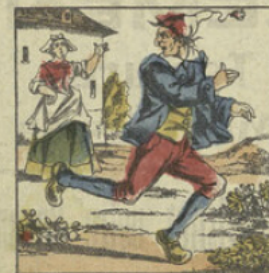
JEAN-DE-NIVELLE. Ce Jean était poltron comme Jean-de-Nivelle, Ici, vous le voyez, il fuit quand on l'appelle.