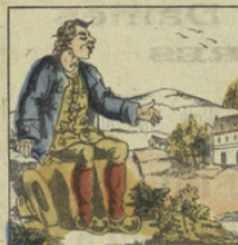
JEAN-DÉTE. Tout le monde me fuit, quoique je sois honnête: A peine ai-je parlé, qu'on prétend que s'endéte.