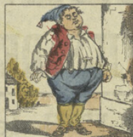
JEAN-GRAISSE. Ce huitième garçon, malgré sa mine épaisse, Est forcé chaque jour de se dire s'engraisse.