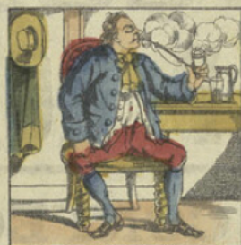
JEAN-FUME. Jean qui vient d'acheter une pipe d'écume, Dit: Le tabac est cher, eh bien! tant pis, s'en fume.