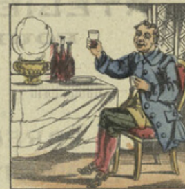
JEAN-BOIS. Mon frère aîné m'invite à dîner quelquefois: Il a de si bon vin, qu'avec plaisir s'en bois.