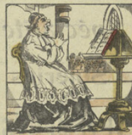
JEAN-TONNE. Je suis chanteur, il faut donc, dès que la messe sonne, Que j'accours au lutrin, et que vite s'en tonne.