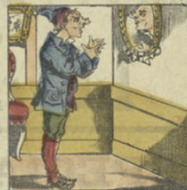
JEAN-LAIDIT. Je vais mourir garçon, dit Jean d'un air contrit; Quoi! des rides au front; ah! vraiment, s'enlaidit.