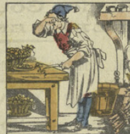
JEAN-PLEURE. L'on m'a dit d'appréter la soupe de bonno-heure, Éprouvons les oignons; ah! s'apristi, s'en pleure.