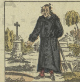
JEAN-TERRE. Ici, vingtième garçon de Jeanneton ma mère, Chaque jour, fol de Jean, plus d'un Jean s'en terre.