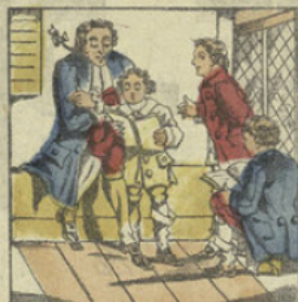
JEAN-COURAGE. Le second fait l'école aux enfants du village, Leur donnant des bons-points, il se dit s'encourage.