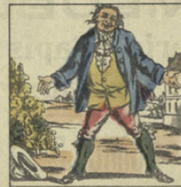
JEAN-RIT. De moi l'on dit du mal, et jamais je n'en fis; Dois-je m'en alarmer? ah! ma foi non, s'en rit.