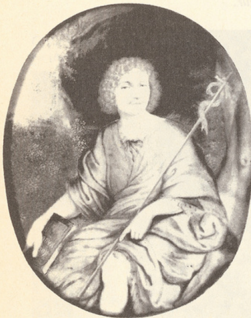
Un anonyme de XVII e (Musée de Pézenas) peint un Molière de pastorelle tenant Dom Juan .

Ce graveur du XIX e en fait un fat, un séducteur. (Acte II, scène IV)