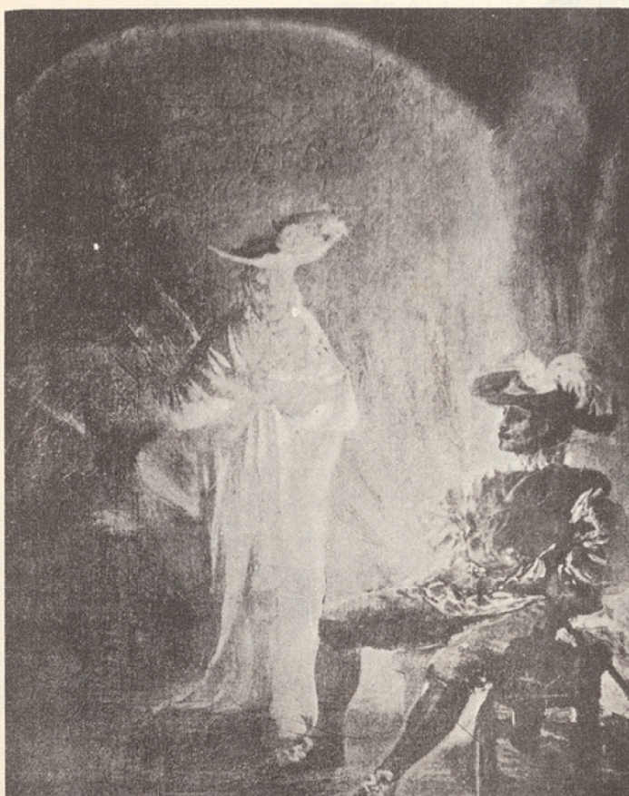
Goya : Don Juan et le Commandeur . Collection de Osuna.