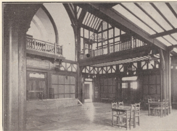
La Salle des Fêtes de la Cité Universitaire. Vue intérieure.

Je n'oublie pas que j'ai eu le grand plaisir, en 1919, de présider à Strasbourg la première manifestation de votre groupement et que déjà, ce jour-là, je saluais auprès des étudiants français un grand nombre de camarades étrangers. « Vous allez, leur disais-je à tous, vous allez travailler côte à côte au développement de la prospérité publique, au progrès de la science, au rehaussement de la civilisation. N'oubliez jamais la journée bénie où vous vous êtes retrouvés et où vous avez senti vos cœurs battre à l'unisson. Vous êtes la France de demain. Promettez à vos hôtes, promettez à toute cette jeunesse, que je salue à vos côtés, promettez-vous