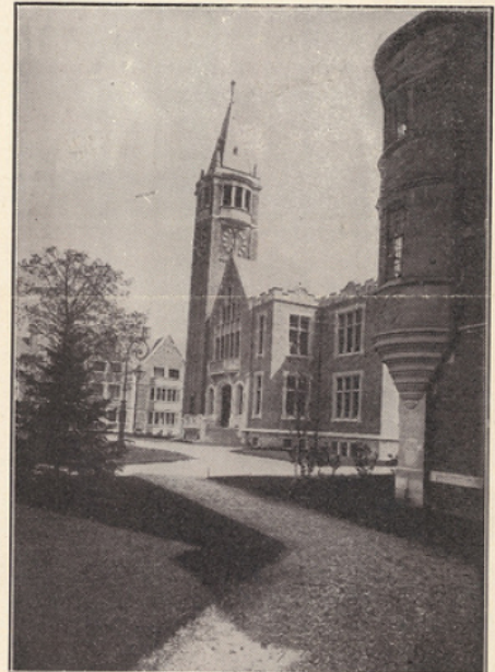
La Salle des fêtes de la Cité universitaire (vue extérieure).

M. Maltini a retracé rapidement l'histoire de la Confédération, souligné le résultat acquis et exposé les espoirs