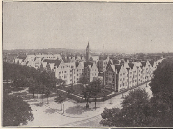
La Cité Universitaire de Paris. — Vue générale.