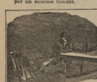
19 Acercando á los viajeros, está aquí este personaje capitan de bandoleros.