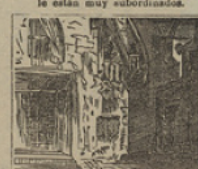
21 Solos y á puerta cerrada los bandidos en consejo están dentro la posada.