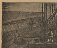
7 Los sobrinos, con aún se embarcan en el «Escocia» en busca del capitan.