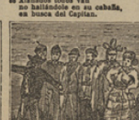
44 Grant les ha manifestado que el codiciado tesoro le había sido robado.