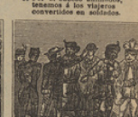
42 Se le presentan mohinos, y el Capitan asombrado, dice no tener sobrinos.