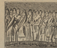
9 Aunque elegantes y hermosas, son, con todo, estas mujeres, en extremo misteriosas.