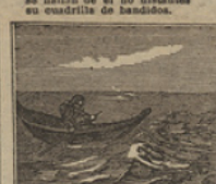
26 Con pena, el lugar se halló, donde hacia poco tiempo que el «Escocia» naufragó.