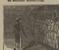
15 Los agguerridos soldados del comandante Fragrante, le están muy subalternos.