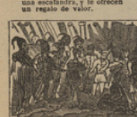
31 Los zelandeses salvajes, pretenden devorarnos para acabar sus viajes.