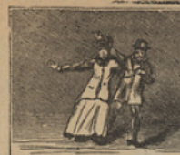
3 Tronados del todo están los pretendidos sobrinos del bravo Capitan Grant.