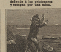
39 ¿Quién dijera al Capitan que es por falsos sobrinos suado con tanto aña?