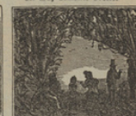
11 Con asombro contemplaron las llanuras argentinas, en donde han desembarcado.