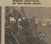
36 Por el suceso animados, temerosos á los viajeros convertidos en soldados.