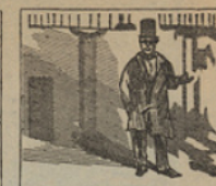
5 Con aires de tejedor observad el bel retrato del muy famoso Doctor.