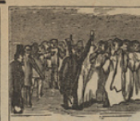
4 Los vecinos convocados examinan el Canuto contentos y entusiasmados.