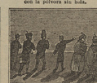
23 Los sobrinos sin parar van en busca del «Escocia» para poderse embarcar.