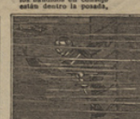
27 El buque se sumergió y un respetable tesoro al fondo del mar quedó.