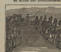
17 Su rabia feroz se exhala huyendo á los viajeros con la pólvora á la baía.