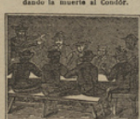
20 Atentos y prevenidos se hallan de él no distantes su cuadrilla de bandidos.