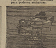
29 Mochila libra un combate con el bandido, logrando de aquel tesoro el rescate.