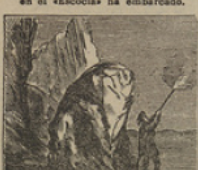
14 Diligente, y con ardor, rescata el guía al médico dando la muerte al Condor.