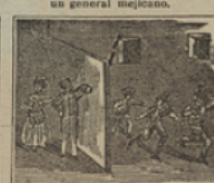
22 De frente son atacados los bandidos, con denuesto, siendo al punto dispersados.