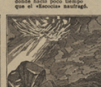
32 Mirad la llama elevada que vomitaba el volcan de la montaña Sagrada.