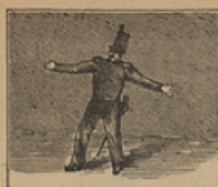
2 Contemplad bien la postura del subteniente Mochila, y su chocante figura.