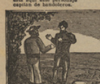
25 Le piden al pescador una escudra, y le ofrecen un regalo de valor.