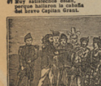
43 Le ruegan tan adigidos y apurados, que á la postre se sienta por sobrinos.