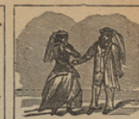
6 Lector, tu mirada fija en estos dos personajes, Lord Glenarvan y su hija.