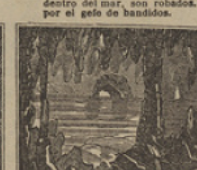
34 Por fin vienen á parar á una grandiosa gruta en las orillas del mar.