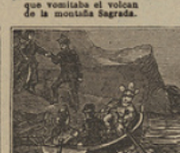
38 Atanados todos van no hallándole en su cabaña, se busca del Capitan.