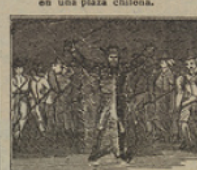
16 En un solitario llano, está arreglada á sus tropas, un general mejicano.