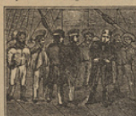
8 El Doctor se ha equivocado, y en vez del «Escocia» ha embarcado.