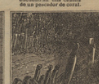
30 La suerte los trajo aquí, adigidos prisioneros en una cueva maori.