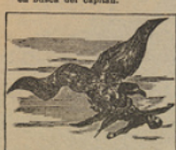
13 A pesar de su valor, el doctor fue arrebatado por un enorme Condor.