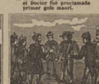
41 Llegó al término su afán, y al cabo de mucho tiempo encuentran al capitan.