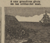
40 La gente examina lista, la soberbia arboladura de un buque que está á la vista.