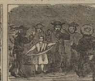
10 De mujeres y hombres llena, está arreglada á sus tropas, en una plaza chilena.