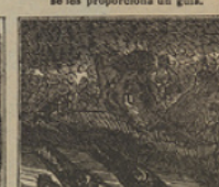
18 En altos bosques estos, para salvar su pellejo de los fieros cocodrilos.