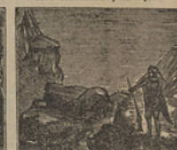
12 Con indecible alegría no conociendo el terreno, se les proporciona un guía.