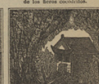
24 Con asombro general, encuentran una cabaña de un pescador de coral.