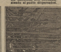
28 Los diamantes sumergidos dentro del mar, son robados por el jefe de bandidos.