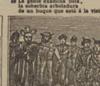
46 Con acertada propuesta propone el Doctor hallarlo, y en efecto, poco cuesta.