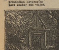
37 Muy satisfechos están, porque hallaron la cabaña del bravo Capitan Grant.