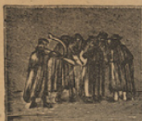
1 Por la murga empezaremos los fabulosos viajes que á rasgos describiremos.