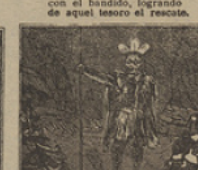
35 Cosa rara pasó allí el Doctor fué proclamado primer jefe maori.